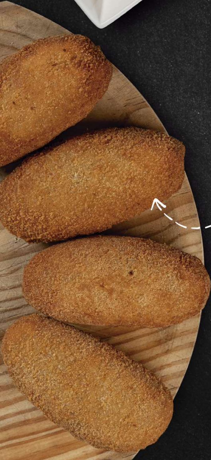
Tabla de Canapés mixtos